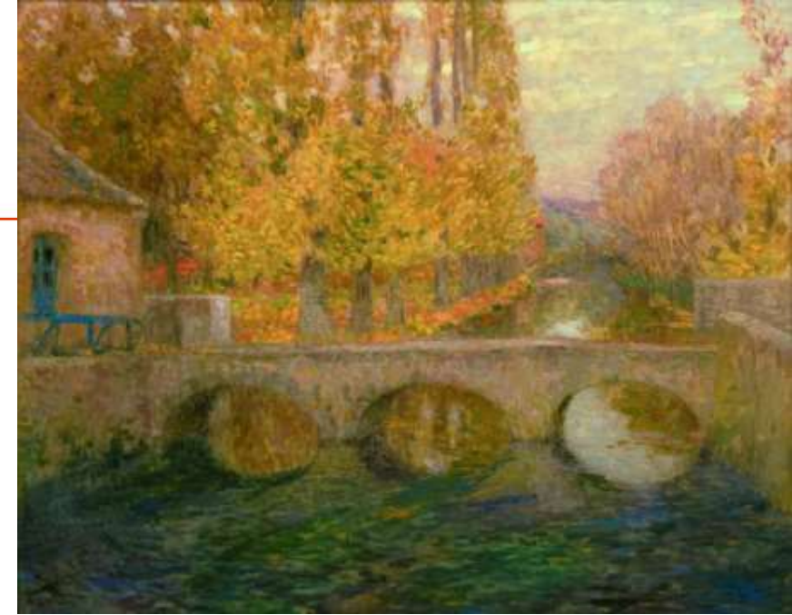
Le pont à Gisor, Automne, Huile sur canevas, Le Sidaner (1904)