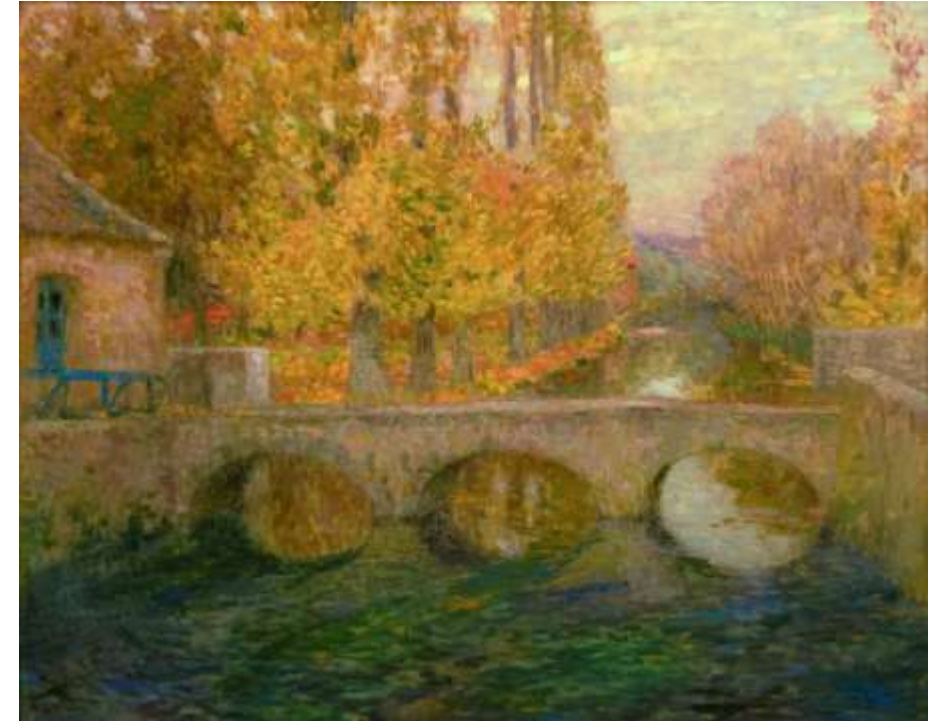
Le pont à Gisor, Automne , Huile sur canevas, Le Sidaner (1904)