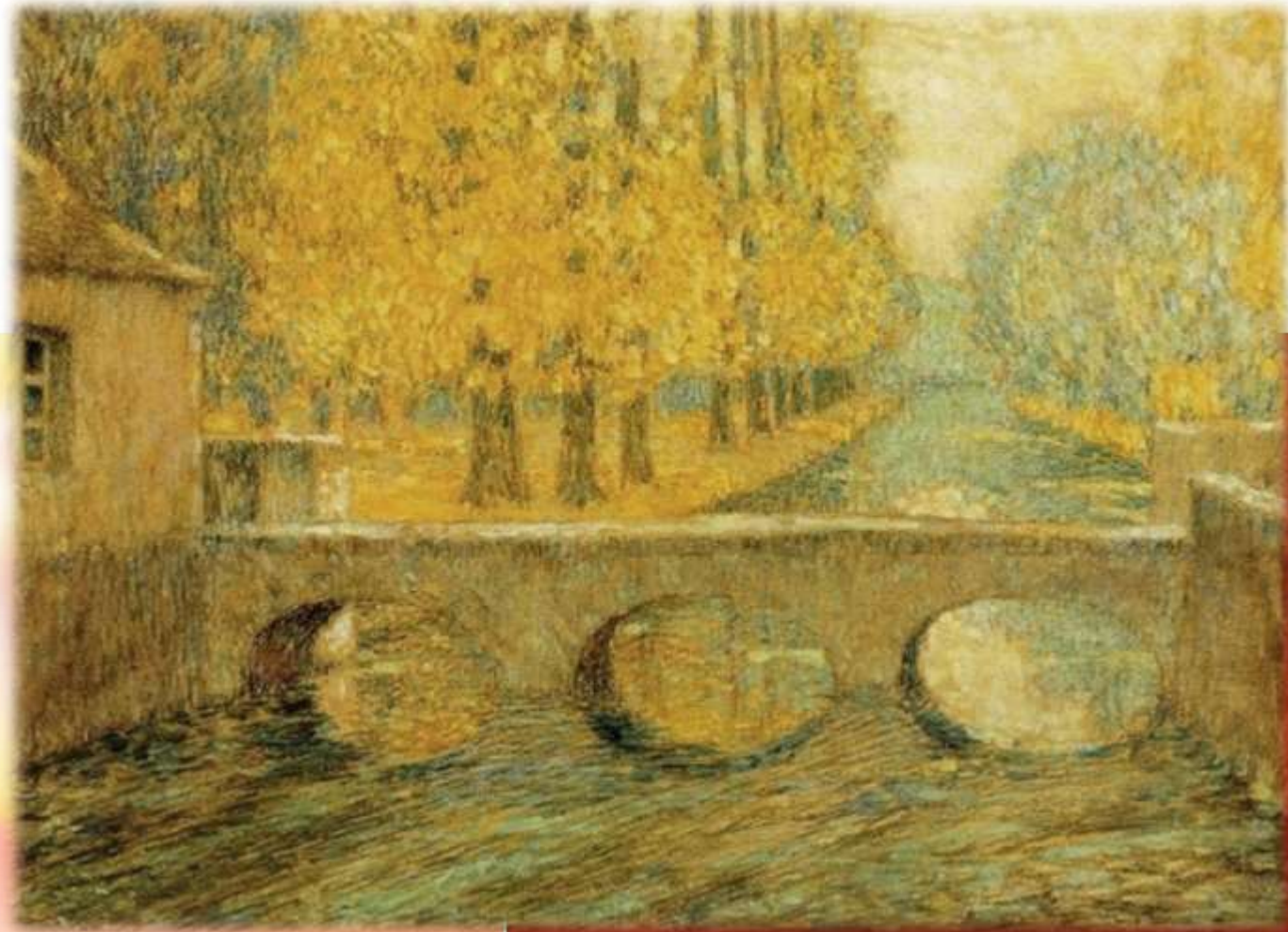
Le pont à Gisor, Automne, 1904, Henri Le Sidaner (1863-1939)